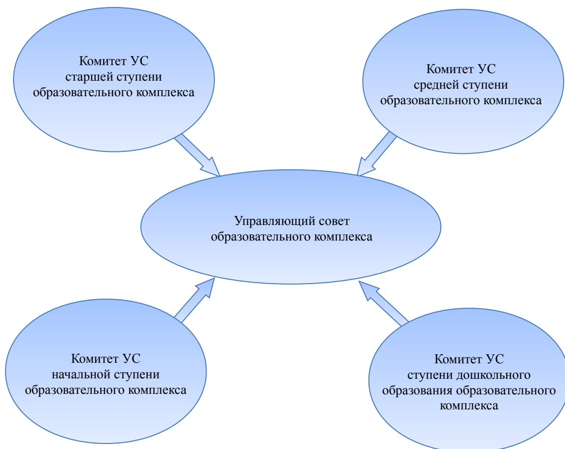
Рис.2. Управляющий совет образовательного комплекса. Второй вариант организации.

сказать и в отношении «структурно-территориального» комитета, рассмотренного в первом варианте.